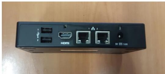
Cm 13 X 8 X 1.5

Il sistema Browser e WEB based permette di gestire i contenuti in modo pressoché automatico, attraverso un dispositivo Smart Box in comodato d'uso